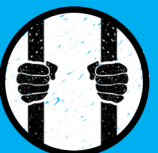
DUINE MUINTEARHTHA ATÁ SA PHRÍOSÚN