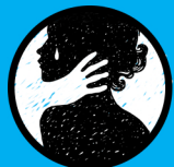
FORÉIGEAN I LEITH NA MÁTHAR